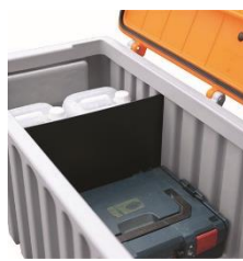
8957 / 8493