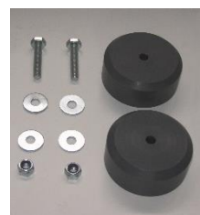
10111 / 8494