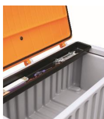
8170 / 8492